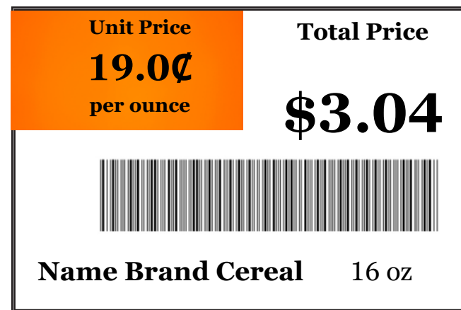
(Cereal de marca reconocida)