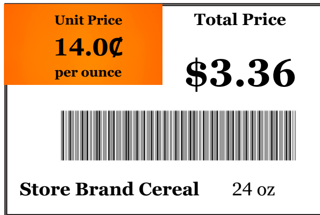
(Cereal de marca de tienda)